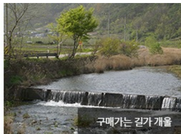
구매가는 길가 개울