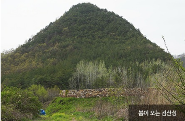
봄이 오는 검산성