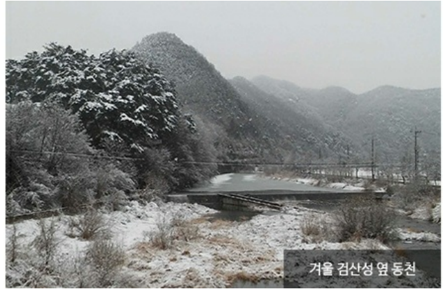
겨울 검산성 옆 동천